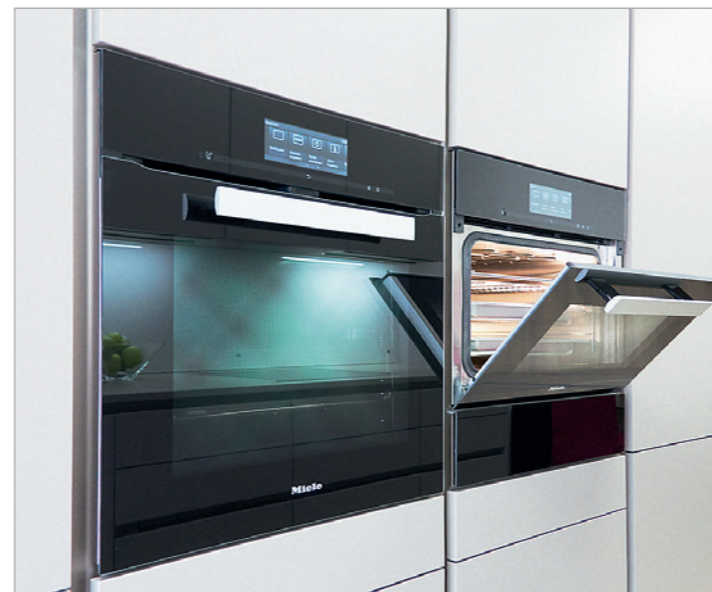
Miele _ Backofen, Dampfgarer mit Backofenfunktion

»Nur wenn das Ganze stimmt, kommt das Detail zum Tragen«