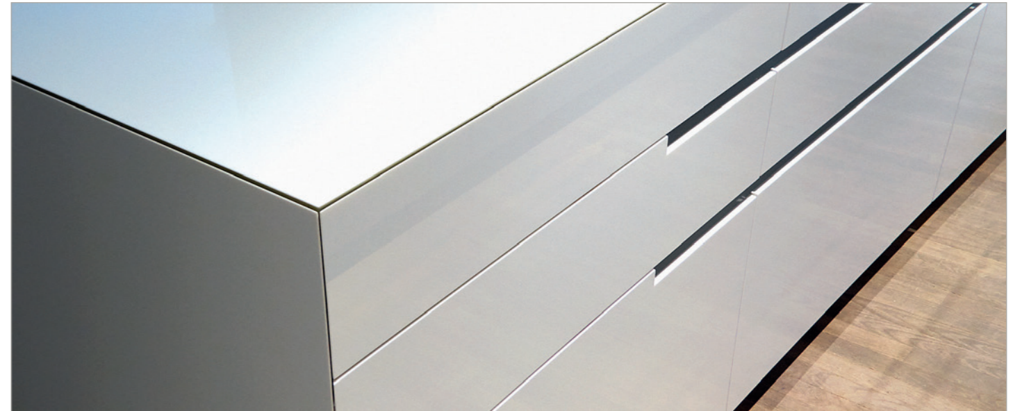
unique by eggersmann _ Arbeitsplatte und Front: Quarzglas

Der vierte Schritt Unsere Monteure sind durch Schulungen und Seminare bei unseren Handlungspartnern top ausgebildet. Sie verfügen über einen sehr großen Erfahrungsschatz. Die sorgfältige Montage Ihrer Küche liegt bei ihnen in besten Händen. Die Endabnahme garantiert das beiderseitige Gefühl, das Beste erreicht zu haben.