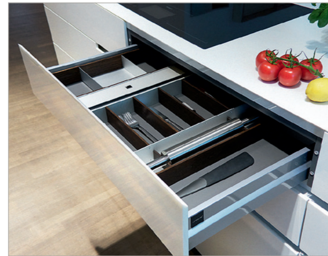
Größte Vielfalt an individuellen Innenausstattungen