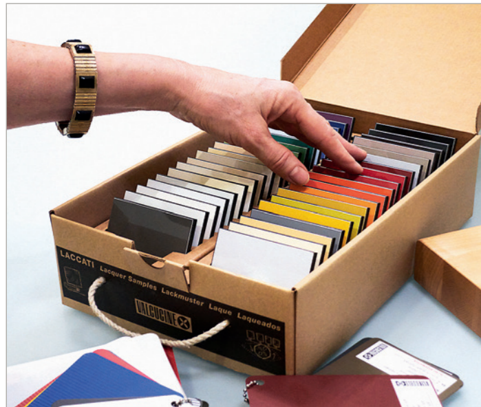
Materialvarianten, Ihre Ideen, unsere Erfahrung